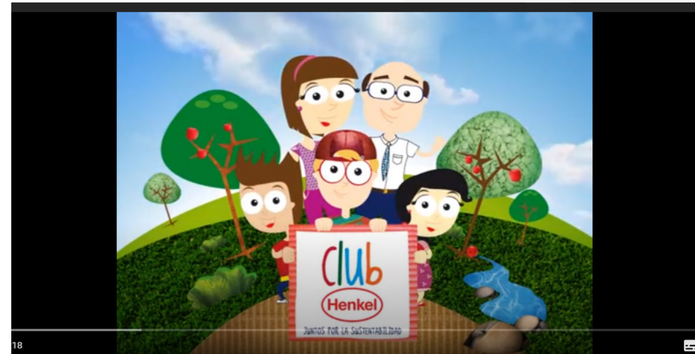
Obra de Teatro "El tiempo y los Henkel"