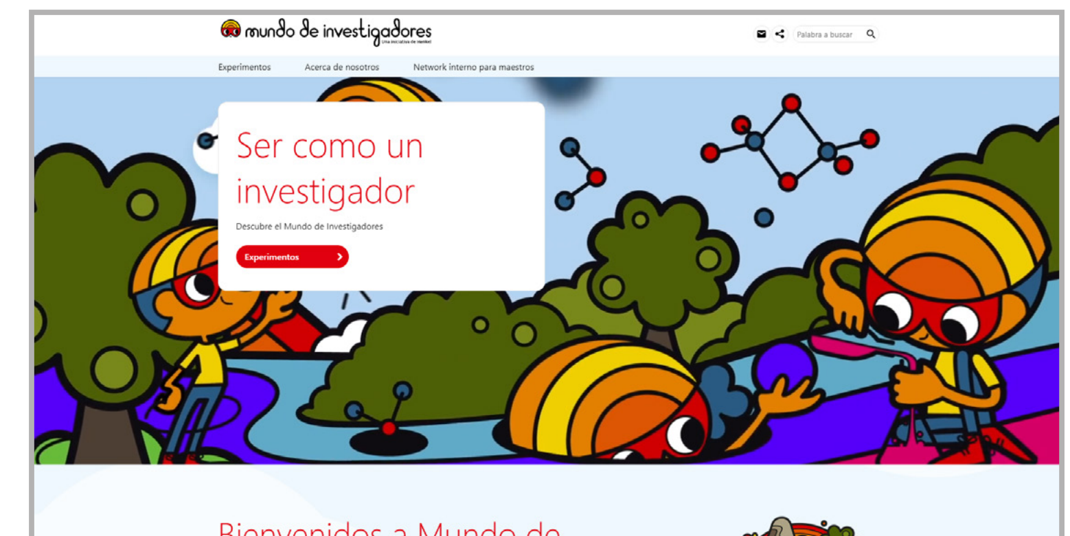
Bienvenidos a Mundo de