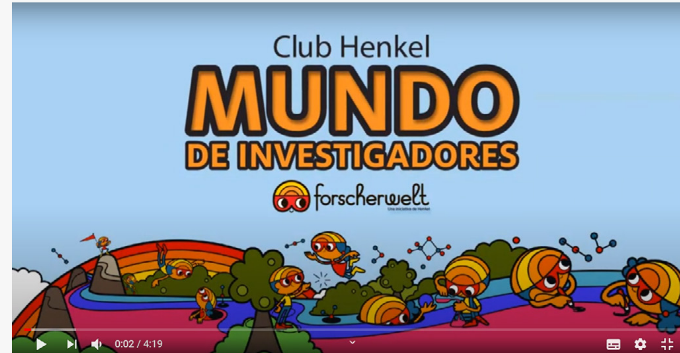
Talles de Ciencias "Forscherwelt"